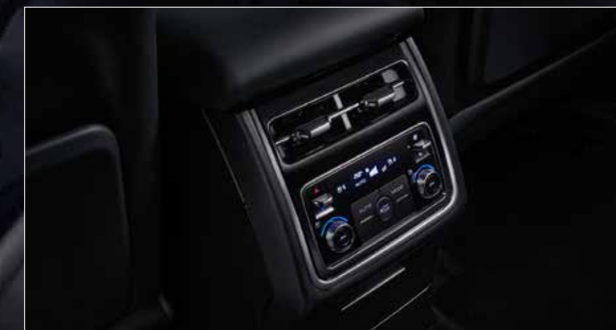
2 nd Row Ventilation Control Panel ระบบควบคุมการระบายอากาศ และระบายความร้อนเบาะแถวที่ 2