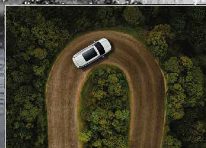
TANK Turn ระบบช่วยกลับรถในพื้นที่แคบ

ไม่มีจุดหมายใดที่ไปไม่ถึงด้วยเทคโนโลยี Off-Road เหนือกว่าในทุกเส้นทางเพื่อก้าวข้ามทุกอุปสรรคด้วยความแข็งแกร่ง