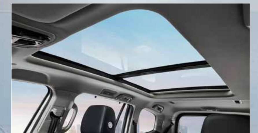
Panoramic Sunroof หลังคาพาโนรามาิคชั้นรูป