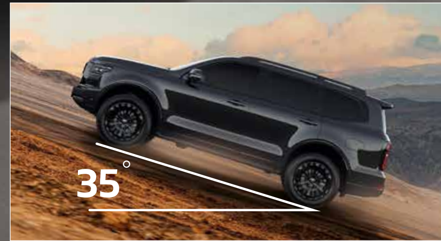
Climbing Ability ความสามารถไต่ทางชัน 35 องศา