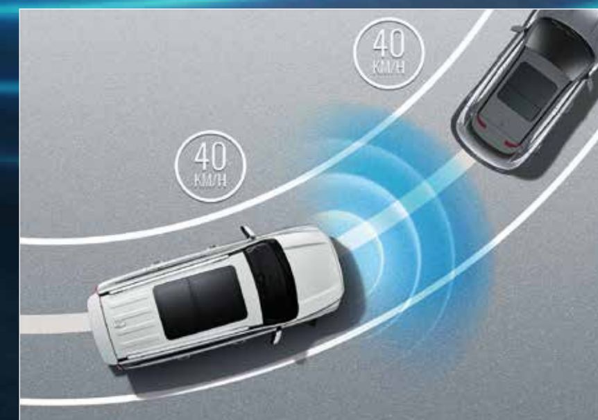
Intelligent ACC ระบบควบคุมความเร็วอัตโนมัติแบบแปรผัน TJA ระบบควบคุมความเร็วอัตโนมัติที่ความเร็วต่ำ