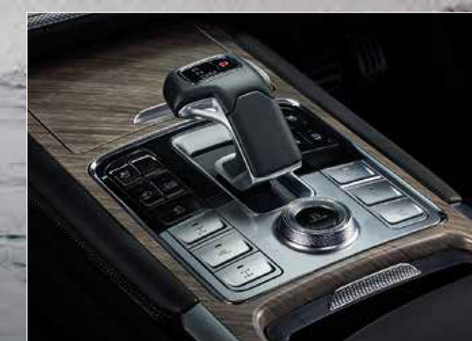
Driving Mode Control - 4WD สวิตช์ควบคุมโหมดการขับขี่