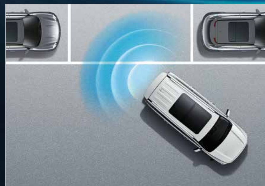
IIP ระบบช่วยจอดรถอัจฉริยะ 3 รูปแบบ กล้องแสดงภาพรอบทิศทาง 360 องศา