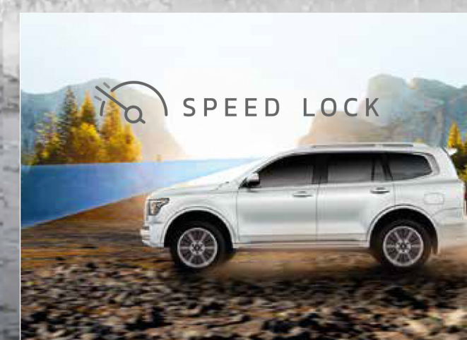
Off-Road Cruise Control ระบบควบคุมความเร็วอัตโนมัติบนเส้นทาง Off-Road