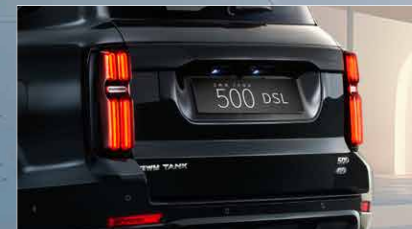
Tailgate with Electric Suction ประตูท้ายพร้อมระบบดูดไฟฟ้า