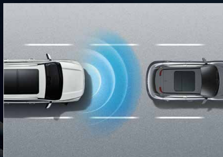
AEBS ระบบช่วยเบรกฉุกเฉินบนทางตรงและทางแยก MEB / L-AEB ระบบช่วยเบรกฉุกเฉินที่ความเร็วต่ำ FCW ระบบช่วยเตือนเมื่อเสียงต่อการชนด้านหน้า