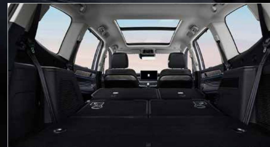
60:40 Foldable Seat พนักพิงเบาะพับได้แบบ 60:40

มอบประสบการณ์แห่งการขับขี่ที่เหนือระดับ ด้วยเบาะที่นั่งหนังคุณภาพสูง และภายในห้องโดยสารที่กว้างขวางพร้อมระบบตัดเสียงรบกวน เพื่อความเป็นส่วนตัวตลอดทุกการเดินทาง รองรับผู้โดยสารได้ถึง 7 ที่นั่ง พร้อมฟังก์ชันปรับเปลี่ยนรูปแบบการใช้งานได้อย่างยืดหยุ่นเพื่อตอบโจทย์ทุกไลฟ์สไตล์ในทุกช่วงเวลาของชีวิต