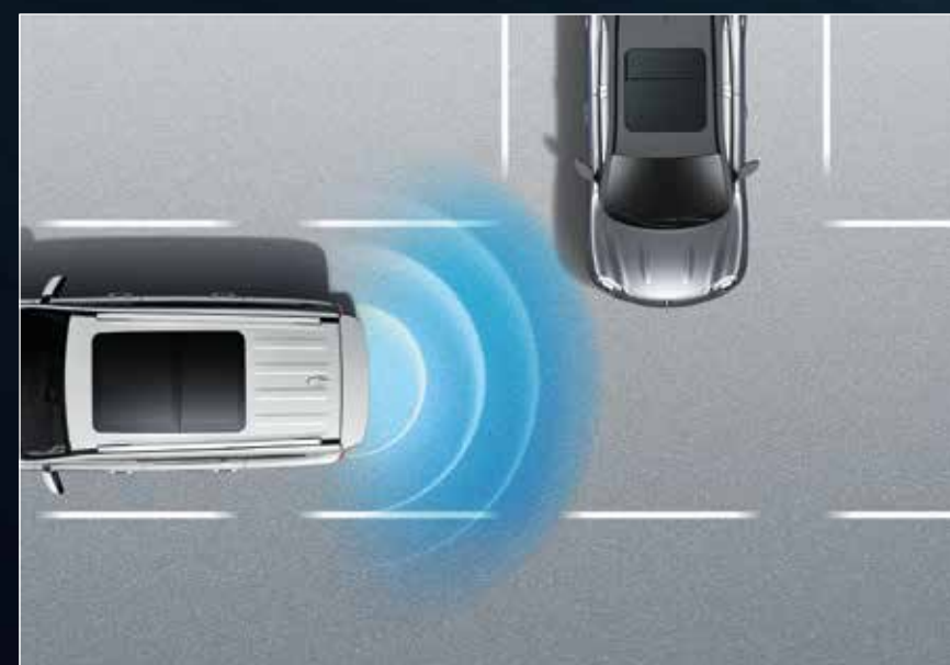
RCTA ระบบช่วยเตือนเมื่อมีรถในจุดอับสายตาขณะถอยหลัง RCTB ระบบช่วยเบรกเมื่อมีรถในจุดอับสายตาขณะถอยหลัง